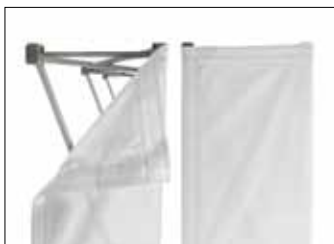
Der Stoffdruck ist mit Klettband bestückt.

Die Lösung für Textildruck in XXL. Soft Image ist das optimale System für die Präsentation von großformatigen Textildrucken. Trotz des niedrigen Gesamtgewichts ist es äußerst stabil konzipiert und lässt sich auch ohne weiteres versetzen.