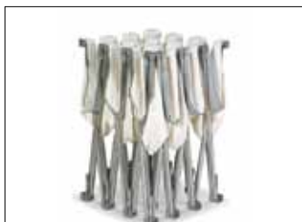
Der Stoff bleibt während des Transports auf dem System.