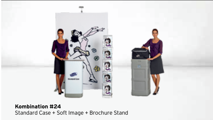
Kombination #24 Standard Case + Soft Image + Brochure Stand