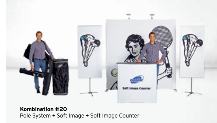
Kombination #20 Pole System + Soft Image + Soft Image Counter