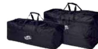
Nylontaschen in verschiedenen Größen stehen zur Auswahl.