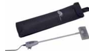
Premium LED-Lampen in Nylontasche. 15 W, 1200 Lumen.