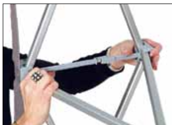
Einfaches sichern und öffnen des Systems.