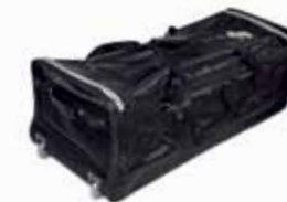
Multibag mit Rollen für einen einfachen Transport.