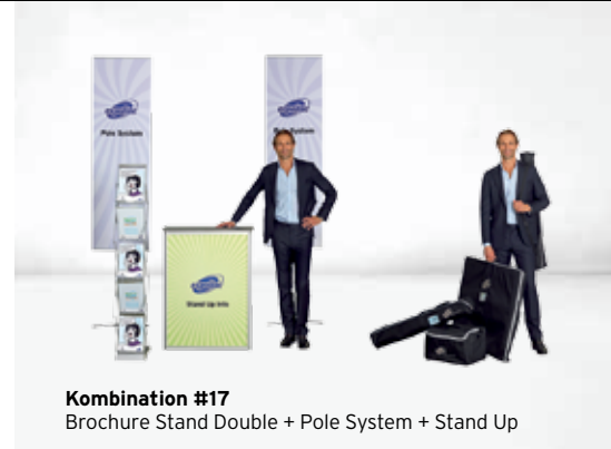
Kombination #17 Brochure Stand Double + Pole System + Stand Up