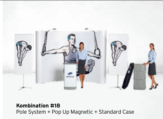
Kombination #18 Pole System + Pop Up Magnetic + Standard Case